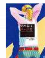
『兄の名は、ジェシカ』