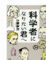
『科学者になりたいたい君へ』