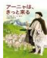
『アーニャは、きっと来る』