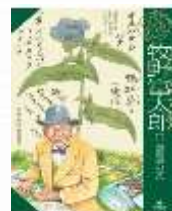
『牧野富太郎： 日本植物学の父』